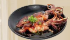
109. Ika Kushi Inktvispiezen van de bakplaat (2 st.)