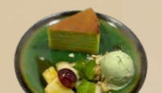
126. Lapis Legit + Ice Cream Spekkoek, een bol ijs en vers fruit + €2,50