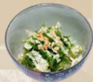
79. Wakame Zeewiersalade