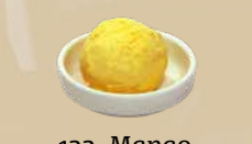
122. Mango Ice Cream Mango-ijs