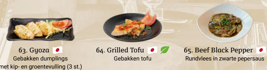
63. Gyoza Gebakken dumplings met kip- en groentevulling (3 st.) 64. Grilled Tofu Gebakken tofu 65. Beef Black Pepper Rundvlees in zwarte pepersaus