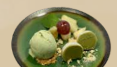
128. Mochi Ice Cream + Ice Cream Mochi-ijs, een bol ijs en vers fruit + €2,50