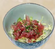
73. Maguro Tartare Tonijnzalade