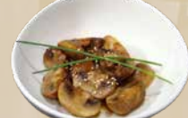
88. Yaki Kinoko Gewokte champignons