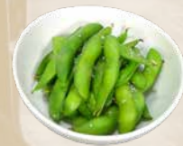
89. Edamame Sojabonen