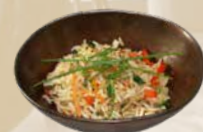
85. Yaki Meshi Gebakken rijst