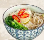
83. Pho Befaamde Vietnamese noodlesoep