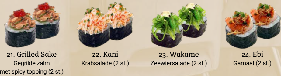
21. Grilled Sake Gegrilde zalm met spicy topping (2 st.) 22. Kani Krabsalade (2 st.) 23. Wakame Zeewiersalade (2 st.) 24. Ebi Garnaal (2 st.)