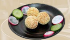
117. Sesam Balls Balletjes van kleefrijst met een bonenpasta (3 st.)