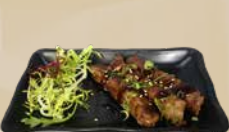
106. Usuyaki Beef Rolls Biefrollen met sperziebonen (3 st.)