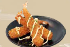
102. Ebi Tempura Garnalen in een krokant jasje (3 st.)