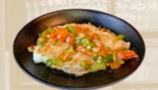
111. Yaki Suzuki Witvis van de bakplaat