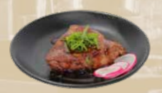
115. Beef Tender Gegrilde diamanthaas