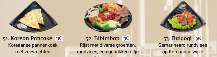
51. Korean Pancake Koreaanse pannenkoek met zeevruchten 52. Bibimbap Rijst met diverse groenten, rundvlees, een gebakken eitje en licht pittige saus 53. Bulgogi Gemarineerd rundvlees op Koreaanse wijze