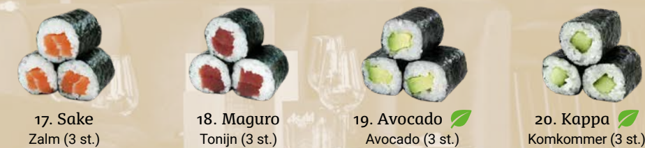
17. Sake Zalm (3 st.) 18. Maguro Tonijn (3 st.) 19. Avocado Avocado (3 st.) 20. Kappa Komkommer (3 st.)