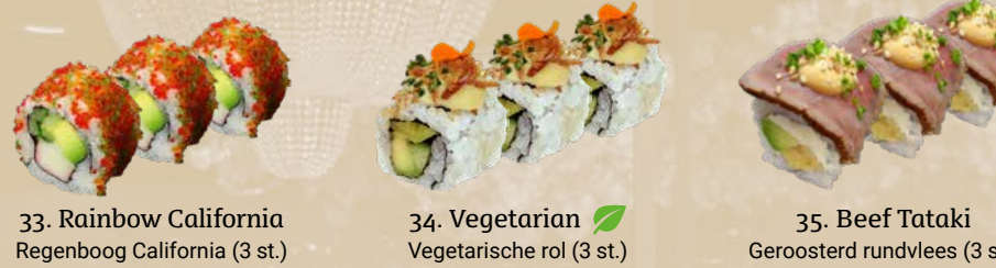
33. Rainbow California Regenboog California (3 st.) 34. Vegetarian Vegetarische rol (3 st.) 35. Beef Tataki Geroosterd rundvlees (3 st.)