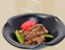
92. Truffle Beef Rundvlees in truffelsaus