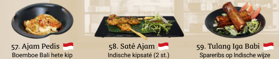
57. Ajam Pedis Boemboe Bali hete kip 58. Saté Ajam Indische kipsaté (2 st.) 59. Tulang Iga Babi Spareribs op Indische wijze