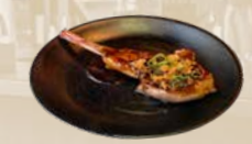
113. Lamb Rack Lamsrack van de bakplaat