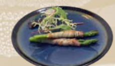
105. Asuperugi Asperges met bacon (2 st.)