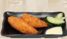
120. Pisang Goreng Gebakken banaan (2 st.)