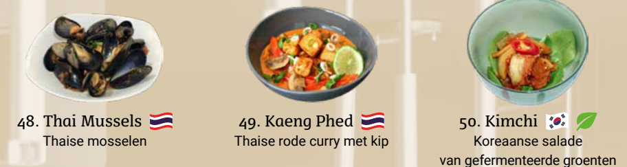
48. Thai Mussels Thaise mosselen 49. Kaeng Phed Thaise rode curry met kip 50. Kimchi Koreaanse salade van gefermenteerde groenten