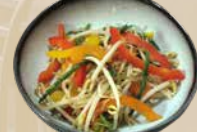
87. Yaki Yasai Gewokte groenten