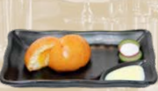
118. Sweet Bun Zoet broodje met vulling