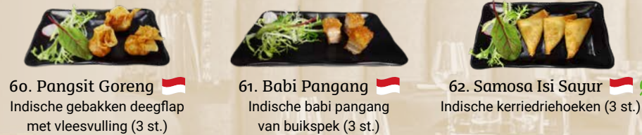
60. Pangsit Goreng Indische gebakken deegflap met vleesvulling (3 st.) 61. Babi Pangang Indische babi pangang van buikspek (3 st.) 62. Samosa Isi Sayur Indische kerriedriehoeken (3 st.)