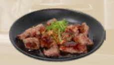
114. Beef Teriyaki Biefstuk in teriyakisaus