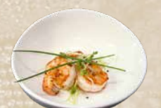
104. Yaki Ebi Garnalen van de bakplaat (3 st.)