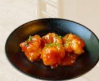
90. Sweet and Sour Ebi Gepaneerde garnalen in zoetzure saus