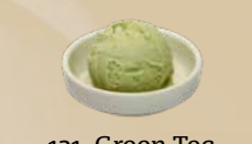
121. Green Tea Ice Cream Groene thee-ijs