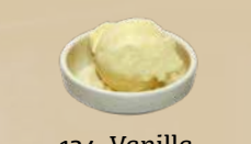
124. Vanilla Ice Cream Vanille-ijs