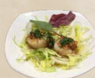
95. Scallop St. Jakobsschelp (2 st.) + €2,50