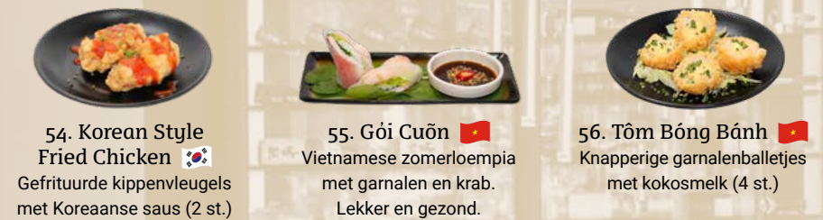
54. Korean Style Fried Chicken Gefrituurde kippenvleugels met Koreaanse saus (2 st.) 55. Gỏi Cuốn Vietnamese zomerloempia met garnalen en krab. Lekker en gezond. 56. Tôm Bông Bánh Knapperige garnalenballetjes met kokosmelk (4 st.)