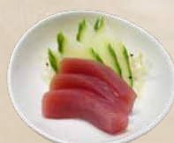
94. Maguro Sashimi Tonijn sashimi + €1,25