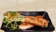
108. Yaki Sake Zalm van de bakplaat