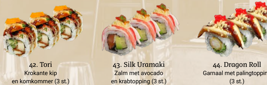
42. Tori Krokante kip en komkommer (3 st.) 43. Silk Uramaki Zalm met avocado en krabtopping (3 st.) 44. Dragon Roll Garnaal met palingtopping (3 st.)