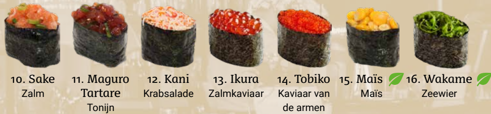
10. Sake Zalm 11. Maguro Tartare Tonijn 12. Kani Krabsalade 13. Ikura Zalmkaviaar 14. Tobiko Kaviaar van de armen 15. Maïs Maïs 16. Wakame Zeewier