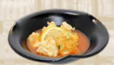
112. Sweet Sour Fish Fillet Visfilet in zoetzure saus