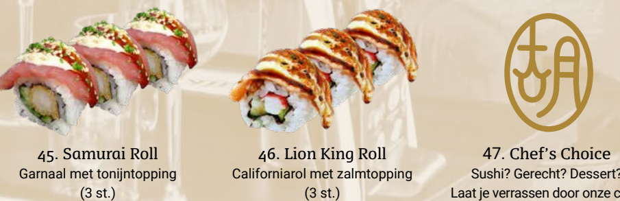
45. Samurai Roll Garnaal met tonijntopping (3 st.) 46. Lion King Roll Californiarol met zalmtopping (3 st.) 47. Chef's Choice Sushi? Gerecht? Dessert? Laat je verrassen door onze chef!