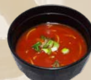
82. Tomato Soup Chinese tomatensoep