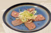
80. Beef Tataki Salade met geroosterd rundvlees