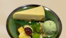
125. Cheesecake + Ice Cream Cheesecake, een bol ijs en vers fruit + €2,50