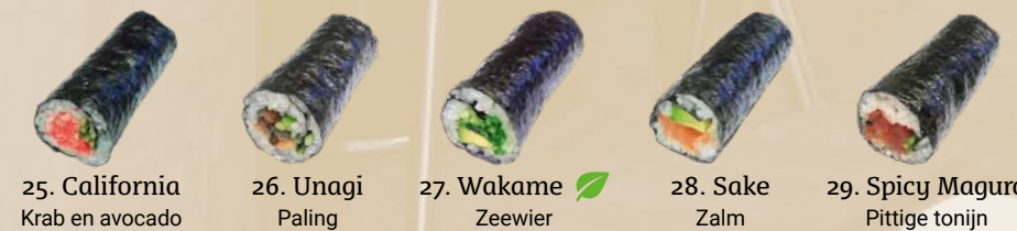
25. California Krab en avocado 26. Unagi Paling 27. Wakame Zeewier 28. Sake Zalm 29. Spicy Maguro Pittige tonijn