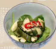
81. Sweet and Sour Pickles Zoetzure komkommersalade