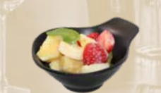
119. Fresh Fruit Vers fruit