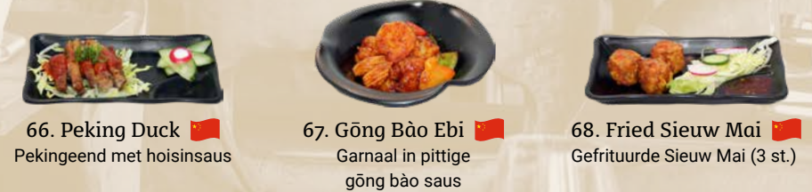
66. Peking Duck Pekingend met hoisinsaus 67. Gōng Bào Ebi Garnaal in pittige gōng bāo saus 68. Fried Sieuw Mai Gefrituurde Sieuw Mai (3 st.)