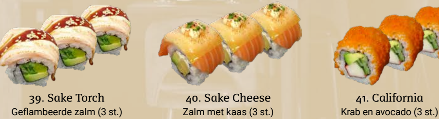
39. Sake Torch Geflambeerde zalm (3 st.) 40. Sake Cheese Zalm met kaas (3 st.) 41. California Krab en avocado (3 st.)