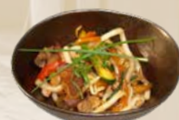
86. Yaki Udon Gebakken udon noedels