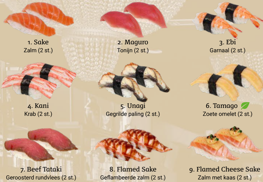
1. Sake Zalm (2 st.) 2. Maguro Tonijn (2 st.) 3. Ebi Garnaal (2 st.)