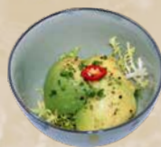
74. Avocado Avocadosalade