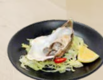
96. Oyster Oester (1 st.) + €1,25