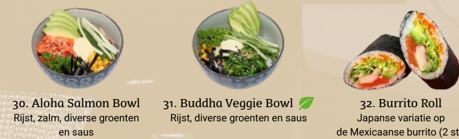
30. Aloha Salmon Bowl Rijst, zalm, diverse groenten en saus 31. Buddha Veggie Bowl Rijst, diverse groenten en saus 32. Burrito Roll Japanse variatie op de Mexicaanse burrito (2 st.)