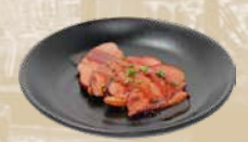
116. Daku Fillet Gegrilde eendenfilet