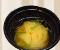
84. Miso Soup Traditionele Japanse soep met dashi en miso