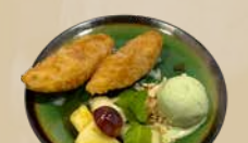
127. Pisang Goreng + Ice Cream Gebakken banaan, een bol ijs en vers fruit + €2,50