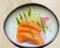
93. Sake Sashimi Zalm sashimi + €1,25