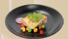
110. Yaki Tara Kabeljauw van de bakplaat