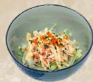
75. Kani Krabzalade