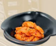
91. Spicy Yaki Sake Zalm in pittige saus