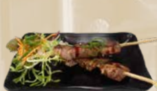
107. Lamb Skewer Lamsspiezen van de bakplaat (2 st.)