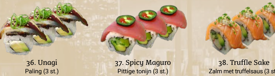
36. Unagi Paling (3 st.) 37. Spicy Maguro Pittige tonijn (3 st.) 38. Truffle Sake Zalm met truffelsaus (3 st.)