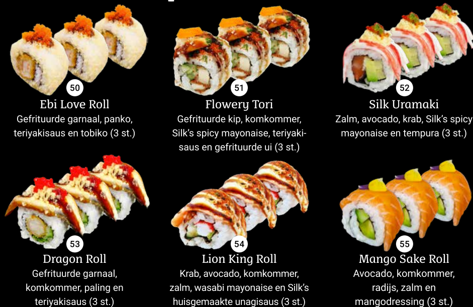
50 Ebi Love Roll Gefrituurde garnaal, panko, teriyakisaus en tobiko (3 st.) 51 Flowery Tori Gefrituurde kip, komkommer, Silk's spicy mayonaise, teriyakisaus en gefrituurde ui (3 st.) 52 Silk Uramaki Zalm, avocado, krab, Silk's spicy mayonaise en tempura (3 st.) 53 Dragon Roll Gefrituurde garnaal, komkommer, paling en teriyakisaus (3 st.) 54 Lion King Roll Krab, avocado, komkommer, zalm, wasabi mayonaise en Silk's huisgemaakte unagisais (3 st.) 55 Mango Sake Roll Avocado, komkommer, radijs, zalm en mangodressing (3 st.)