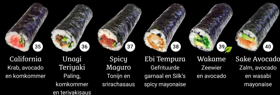
35 California Krab, avocado en komkommer 36 Unagi Teriyaki Paling, komkommer en teriyakisaus 37 Spicy Maguro Tonijn en srirachasaus 38 Ebi Tempura Gefrituurde garnaal en Silk's spicy mayonaise 39 Wakame Zeewier en avocado 40 Sake Avocado Zalm, avocado en wasabi mayonaise