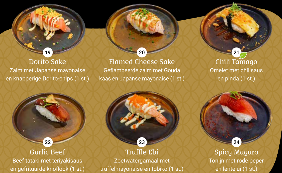
19 Dorito Sake Zalm met Japanse mayonaise en knapperige Dorito-chips (1 st.) 20 Flamed Cheese Sake Geflambeerde zalm met Gouda kaas en Japanse mayonaise (1 st.) 21 Chili Tamago Omelet met chilisaus en pinda (1 st.) 22 Garlic Beef Beef tataki met teriyakisaus en gefrituurde knoflook (1 st.) 23 Truffle Ebi Zoetwatergarnaal met truffelmayonaise en tobiko (1 st.) 24 Spicy Maguro Tonijn met rode peper en lente ui (1 st.)