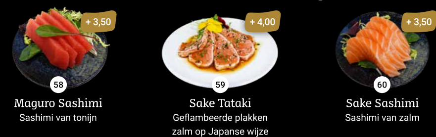
58 Maguro Sashimi Sashimi van tonijn + 3,50 59 Sake Tataki Geflambeerde plakken zalm op Japanse wijze + 4,00 60 Sake Sashimi Sashimi van zalm + 3,50