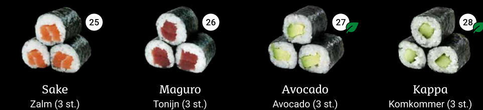
25 Sake Zalm (3 st.) 26 Maguro Tonijn (3 st.) 27 Avocado Avocado (3 st.) 28 Kappa Komkommer (3 st.)