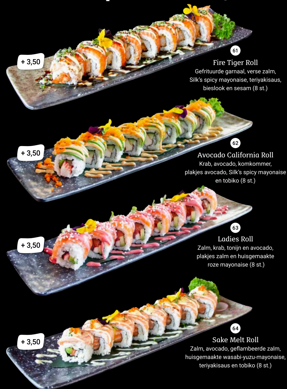
61 Fire Tiger Roll Gefrituurde garnaal, verse zalm, Silk's spicy mayonaise, teriyakisaus, bieslook en sesam (8 st.) + 3,50 62 Avocado California Roll Krab, avocado, komkommer, plakjes avocado, Silk's spicy mayonaise en tobiko (8 st.) + 3,50 63 Ladies Roll Zalm, krab, tonijn en avocado, plakjes zalm en huisgemaakte roze mayonaise (8 st.) + 3,50 64 Sake Melt Roll Zalm, avocado, geflambeerde zalm, huisgemaakte wasabi-yuzu-mayonaise, teriyakisaus en tobiko (8 st.) + 3,50