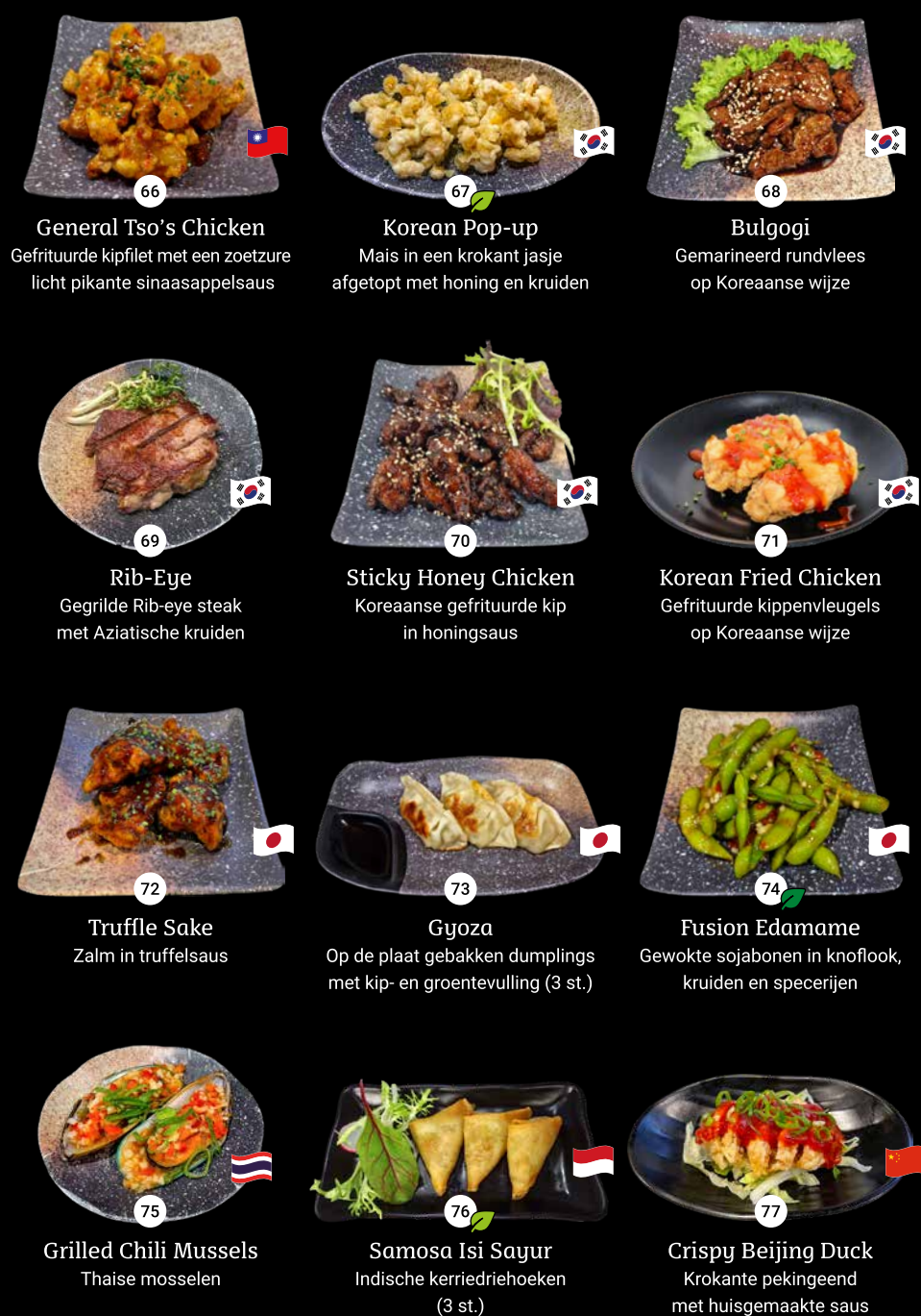
66 General Tso's Chicken Gefrituurde kipfilet met een zoetzure licht pikante sinaasappelsaus 67 Korean Pop-up Mais in een krokant jasje afgetopt met honing en kruiden 68 Bulgogi Gemarkte rundvlees op Koreaanse wijze 69 Rib-Eye Gegrilde Rib-eye steak met Aziatische kruiden 70 Sticky Honey Chicken Koreaanse gefrituurde kip in honingsaus 71 Korean Fried Chicken Gefrituurde kippenvleugels op Koreaanse wijze 72 Truffle Sake Zalm in truffelsaus 73 Gyoza Op de plaat gebakken dumplings met kip- en groentevulling (3 st.) 74 Fusion Edamame Gewokte sojabonen in knoflook, kruiden en specerijen 75 Grilled Chili Mussels Thaise mosselen 76 Samosa Isi Sayur Indische kerriedriehoeken (3 st.) 77 Crispy Beijing Duck Krokante pekingeend met huisgemaakte saus