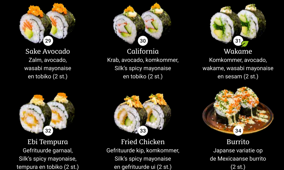
29 Sake Avocado Zalm, avocado, wasabi mayonaise en tobiko (2 st.) 30 California Krab, avocado, komkommer, Silk's spicy mayonaise en tobiko (2 st.) 31 Wakame Komkommer, avocado, wakame, wasabi mayonaise en sesam (2 st.) 32 Ebi Tempura Gefrituurde garnaal, Silk's spicy mayonaise, tempura en tobiko (2 st.) 33 Fried Chicken Gefrituurde kip, komkommer, Silk's spicy mayonaise en gefrituurde ui (2 st.) 34 Burrito Japanse variatie op de Mexicaanse burrito (2 st.)