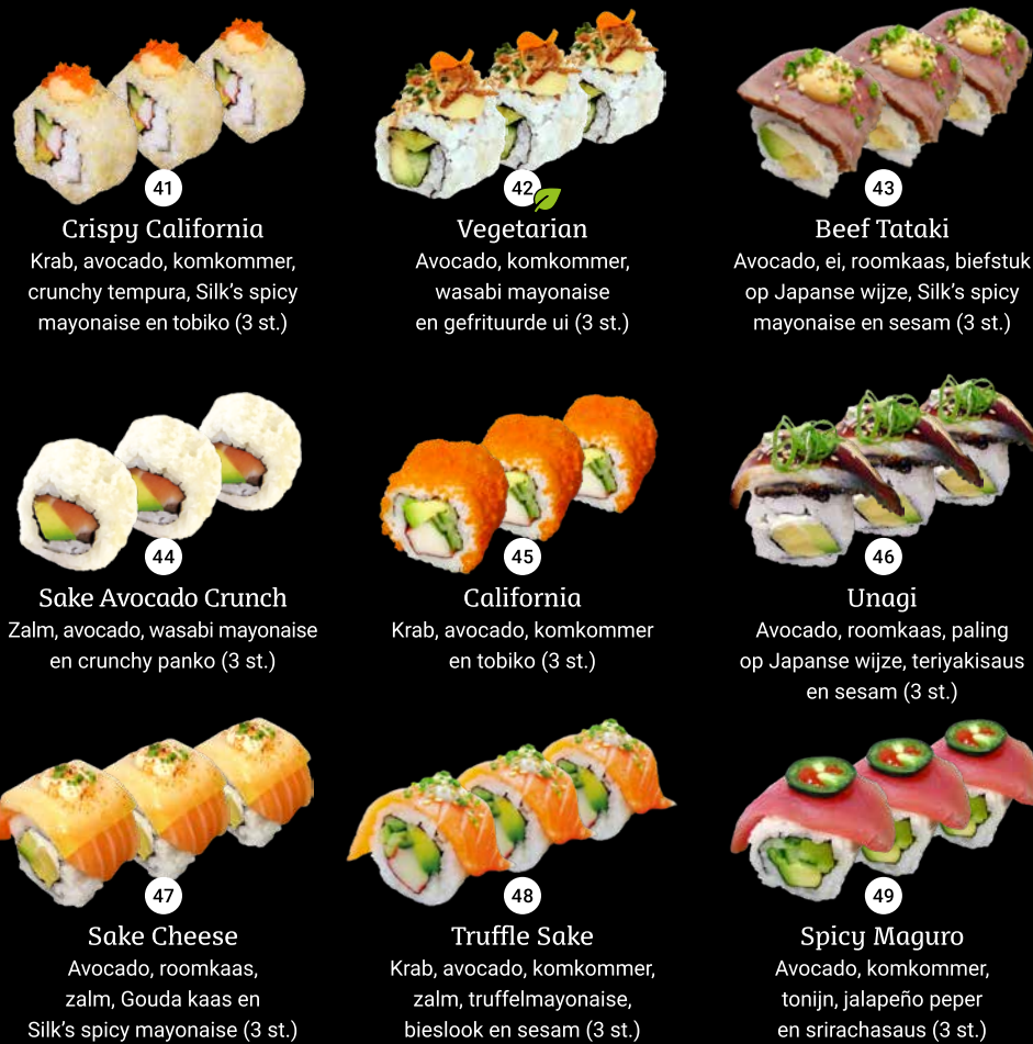
41 Crispy California Krab, avocado, komkommer, crunchy tempura, Silk's spicy mayonaise en tobiko (3 st.) 42 Vegetarian Avocado, komkommer, wasabi mayonaise en gefrituurde ui (3 st.) 43 Beef Tataki Avocado, ei, roomkaas, biefstuk op Japanse wijze, Silk's spicy mayonaise en sesam (3 st.) 44 Sake Avocado Crunch Zalm, avocado, wasabi mayonaise en crunchy panko (3 st.) 45 California Krab, avocado, komkommer en tobiko (3 st.) 46 Unagi Avocado, roomkaas, paling op Japanse wijze, teriyakisaus en sesam (3 st.) 47 Sake Cheese Avocado, roomkaas, zalm, Gouda kaas en Silk's spicy mayonaise (3 st.) 48 Truffle Sake Krab, avocado, komkommer, zalm, truffelmayonaise, bieslook en sesam (3 st.) 49 Spicy Maguro Avocado, komkommer, tonijn, jalapeño peper en srirachasaus (3 st.)